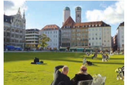
Freifläche am Marienhof, Foto: © Leonie Baumeister, 2014

Rathausgalerie | Marienplatz 8 Die neue Jahresausstellung des Referats für Stadtplanung und Bauordnung stellt die Entwicklung der Innenstadt in den Fokus. Öffnungszeiten: tägl. 11.00–19.00 h www.muenchen.de/plan