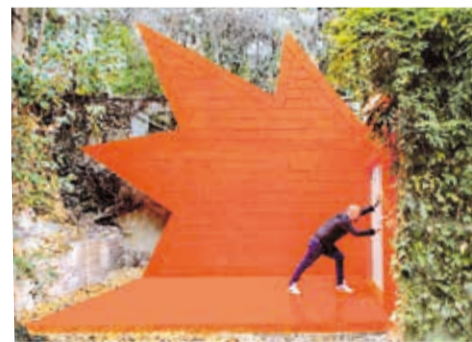
»Explosive installation« at the entrance of »Villa André Bloc«, Paris. © Didier Faustino, 2014

It is part of the experiment. All the work is experimenting and training. I don't believe in failure. Maybe often there is a failure in terms of not constructing the building but it's not a failure in terms of architecture, because the project is on paper. And one idea evolves into the next idea. The aim is just to redevelop or reinforce the idea you developed today. I don't start with yesterday but the situation today.