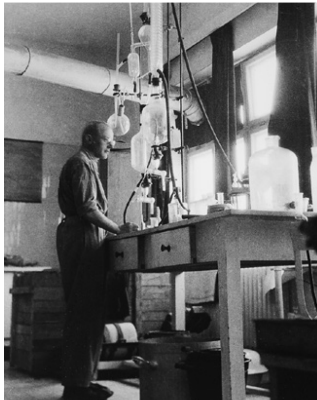
Ein KZ-Häftling in der Dachauer „Kräuterplantage“, wahrscheinlich im dortigen Forschungsinstitut für Heilpflanzenbau und Ernährungskunde. Heinrich Himmler (Diplom-Landwirt an der TH München 1922) hatte die Plantage 1938 errichtet. Einzelne THM-Hochschullehrer berieten bzw. unterhielten Forschungs Kooperationen mit der SS.