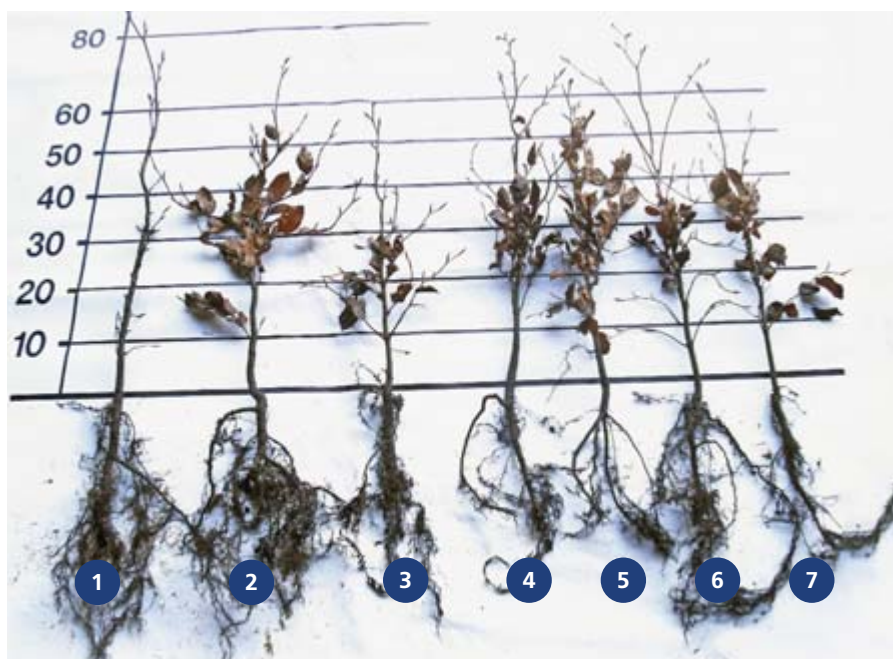
Abbildung 2: Rotbuchensämlinge 2+0, 50–80 cm; Qualitätskriterien Spross und Wurzel: dargestellt sind 7 Sämlinge, alle mit wipfelschäftigen Sprossen, arttypischer Ausbildung des Seitenholzes und gutem Wurzelhalsdurchmesser. Demgegenüber sind die Wurzeln jedoch nicht durchgängig gut ausgebildet: während die Pflanzen 1, 2, 3 und 6 eine gute Wurzelentwicklung aufweisen (ordentliche Wurzellängen, gutes Wurzel-Spross-Verhältnis von 1:2–1:4 und ausreichende Feinwurzelmasse), sind die Wurzeln der Pflanzen 4, 5 und 7 suboptimal ausgebildet.

Das arttypische Wurzelsystem der Rotbuche ist ein Herzwurzelsystem. Bei Jungpflanzen ist dies jedoch noch nicht entwickelt. Eine Qualitätsbeurteilung der jungen Wurzel wird daher zunächst noch allgemeiner Art sein müssen: Pflanzen mit erkennbaren J-Wurzeln oder L-Wurzeln (Wurzelverkrümmung durch Verschulung) dürfen nicht akzeptiert werden. Die