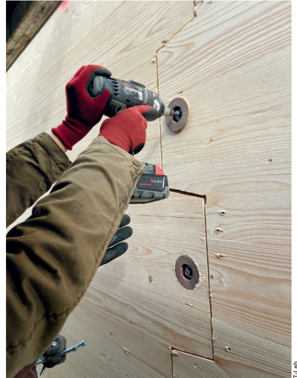
Die Konusdübel übertragen Scherkräfte in der formschlüssigen Verbindung der Wand- und Deckenelemente mit dem Tragwerk.

Die Dreigelenkrahmen wurden im Werk des Kunstharzpressholz-Herstellers testweise zusammengebaut, anschließend wieder zerlegt und zur Baustelle transportiert. Zudem montierte eine lokale Holzbau-firma zwei der Rahmen zusammen mit Wand- und Dachelementen zu einer Probeachse im Maßstab 1:1.