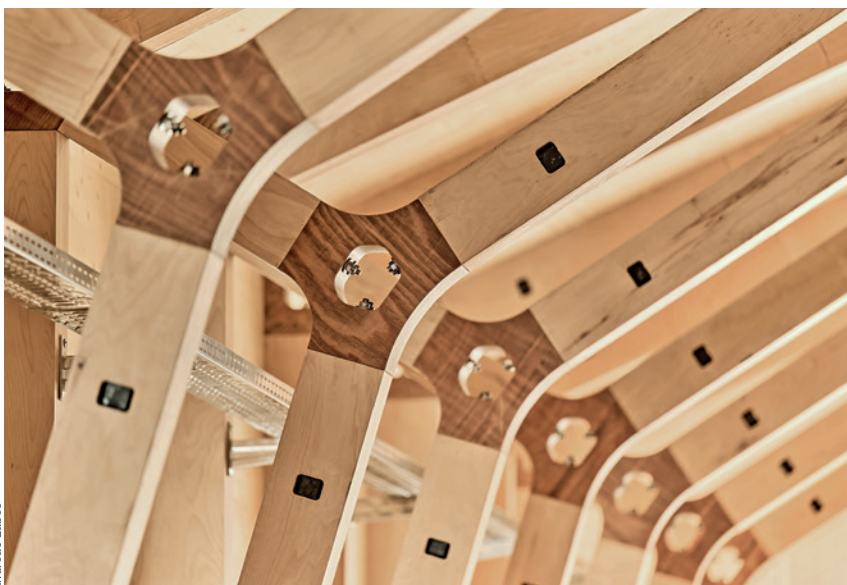
Die Ringknoten schließen formschlüssig an die Stäbe aus Buchenfurnierschichtholz an. Die Zugkräfte werden durch die Vorspannung der Stäbe übertragen.

The three-pin portal frames underwent a trial assembly in the compreg manufacturer's factory before being taken apart and