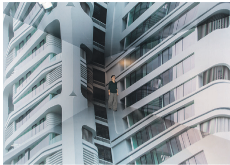
Motion Matters, © Cesare Querci

Architekturgalerie München | Türkenstr. 30 Die neue Ausstellung der Architekturgalerie präsentiert eine Auswahl von UNStudio Schlüsselprojekten aus 26 Jahren Architekturgestaltung, das gegenwärtige Konzept des Architekturbüros und den breiten Diskurs, der heutzutage Herausforderungen in der Entwurfsgestaltung bestimmt. Dabei kreiert sie gleichzeitig ein räumlich dynamisches Erlebnis. Öffnungszeiten: Mo-Mi 9.30 – 19.00 h, Do-Fr 09.30 – 19.30 h, Sa 09.30 – 18.00 h www.architekturgalerie-muenchen.de