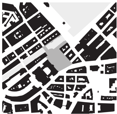
Hamburg Rathausplatz Schwarzplan und Axonometrie, © Lehrstuhl für Städtebau und Regionalplanung

Zwar gibt es umfangreiche Publikationen zum Thema „Platz“, doch sind diese oft rein architekturhistorisch orientiert und in den wenigsten Fällen durch Zeichnungen unterstützt. Eine durchgängig maßstabsgetreue Darstellung fehlt bis auf wenige Ausnahmen bisher weitgehend. Diese Lücke soll der PLATZATLAS schließen.