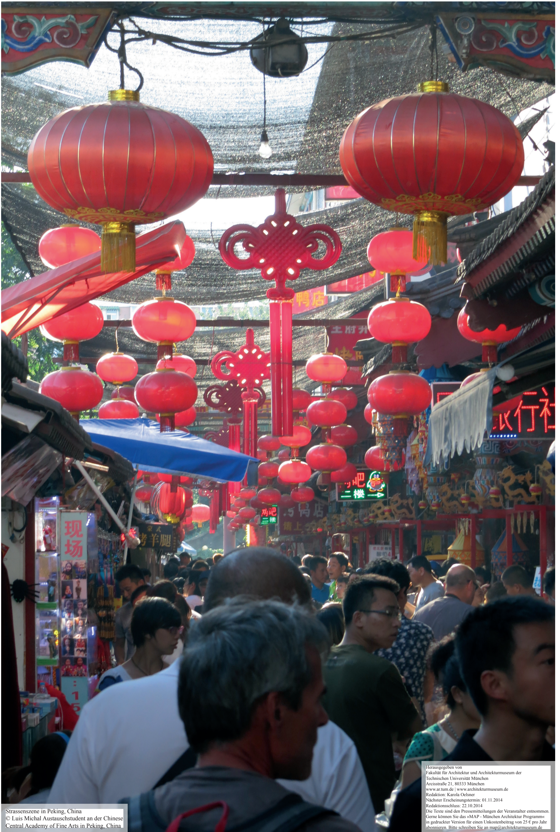
Strassenszene in Peking, China © Luis Michal Austauschstudent an der Chinese Central Academy of Fine Arts in Peking, China

Herausgegeben von Fakultät für Architektur und Architekturmuseum der Technischen Universität München Arcisstraße 21, 80333 München www.ar.tum.de | www.architekturmuseum.de Redaktion: Karola Oelsner Nächster Erscheinungstermin: 01.11.2014 Redaktionsschluss: 22.10.2014 Die Texte sind den Pressemitteilungen der Veranstalter entnommen. Gerne können Sie das »MAP - München Architektur Programm« in gedruckter Version für einen Unkostenbeitrag von 25 € pro Jahr abonnieren. Bitte schreiben Sie an map@architekturmuseum.de