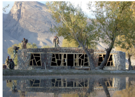
Besucherzentrum, Pamir-i-Buzurg, Afghanistan © AFIR Architects/ Anne Feenstra

Architekturmuseum der TU München in der Pinakothek der Moderne | Barerstr. 40 Städte in der Postkonfliktphase haben wiederkehrende, vergleichbare Probleme. Politisches Machtvakuum auf der nationalen Ebene und das Fehlen von Selbstüberwachung der Bürger erzeugen unkontrollierte Kräfte, die sich u.a. auch äußerst hinderlich auf die Chancen für die Wiederherstellung der Städte auswirken. Die Ausstellung beruht auf der jahrelangen Projektarbeit eines Netzwerkes von Architekten, Stadtplanern und Wissenschaftlern der internationalen Plattform »Archis Interventions«. In Kriegsgebieten reagieren sie auf die spezifischen Postkonfliktsituationen und unterstützen die Städte mit aktiven Interventionen und integrativen Planungsstrategien beim Wiederaufbau als friedenssichernde Maßnahme. Öffnungszeiten: Di - So 10.00 - 18.00 h, Do 10.00 - 20.00 h www.architekturmuseum.de