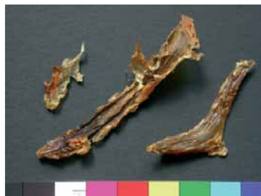
5 Bei unpräpariert getrockneten Schwimmblasen reagiert das leimgebende Gewebe mit dem im Gewebe eingelagerte Fett: Es wird dunkel.