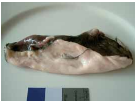
4 Frische Schwimmblase nach der Entnahme aus dem Fischbauch