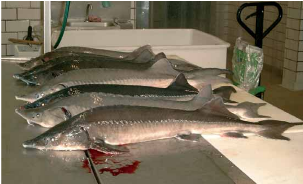
1 Zuchtstöre ( Acipenser baeri ), 18 Monate alt