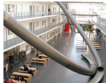
Teilbibliothek Mathematik & Informatik