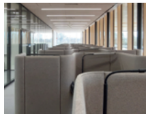
Teilbibliothek Sport- & Gesundheitswissenschaften