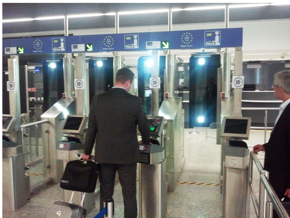
Abbildung 4: Das EasyPASS System kann Personen identifizieren und ihre Identität verifizieren.

Im Gegensatz zu einer effektiven und effizienten Gestaltung der Anwendungen stehen die Erfahrungen der australischen Regierung mit der „Online Compliance Intervention“, die das Eintreiben von Steuerschulden erleichtern sollte, aber letztlich in einem politischen Skandal mündete. Ein Algorithmus glich verschiedene steuerrelevante Daten ab. Fand er dabei Widersprüche, benachrichtigte er den Bürger per Brief und SMS. Widerspruch der Bürger nicht, wurde ein Zahlungsbescheid erlassen, gegen welchen