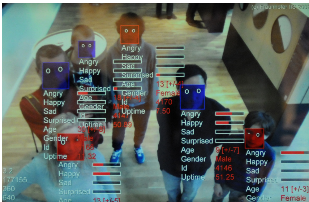
Abbildung 3 : Eine smarte Kamera erkennt Alter, Geschlecht und Gemütszustand.

Zwecke, Chancen und Risiken lassen sich nicht einfach zuordnen. Gemeinhin wird KI als Gefahr für die informationelle Selbstbestimmung gesehen, was sich anhand verschiedener Anwendungen der intelligenten Videoüberwachung zeigen lässt, wie sie auch in Deutschland getestet werden. Am Bahnhof Südkreuz in Berlin führt die Bundespolizei einen Versuch mit intelligenter Gesichtserkennung durch Kameras durch. Ziel ist es dabei, durch Technologien der Mustererkennung Personen eindeutig identifizieren zu können, um gesuchte Personen herauszufiltern. 14 Ein Versuch in Mannheim soll sogar die KI-gestützte Erkennung von sozialen Situationen ermöglichen. Ein Kamerasystem soll die Polizei benachrichtigen, wenn kriminelle Handlungen im Raum stehen. Bestimmte Aktivitäten wie etwa eine gewaltsame Auseinandersetzung werden erkannt. Dann besteht die Möglichkeit, die beteiligten Personen über das gesamte Kamerasystem zu verfolgen. 15 Beide Beispiele