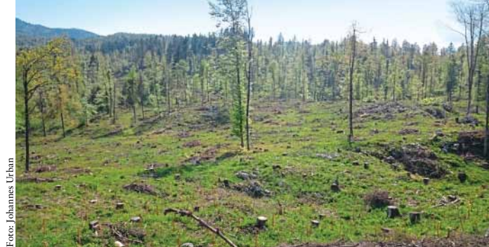
Eis Sturm im Jahr 2014 verursacht große Schäden in Slowenien: Fläche westlich von Ljubljana nach der Aufarbeitung im Jahr 2018

Forstwirtschaft sind es oft kleinräumige Faktoren, welche die Entwicklung eines Waldbestands steuern. Diese Details können mit überregionalen (Klima-) Modellen kaum abgebildet werden.