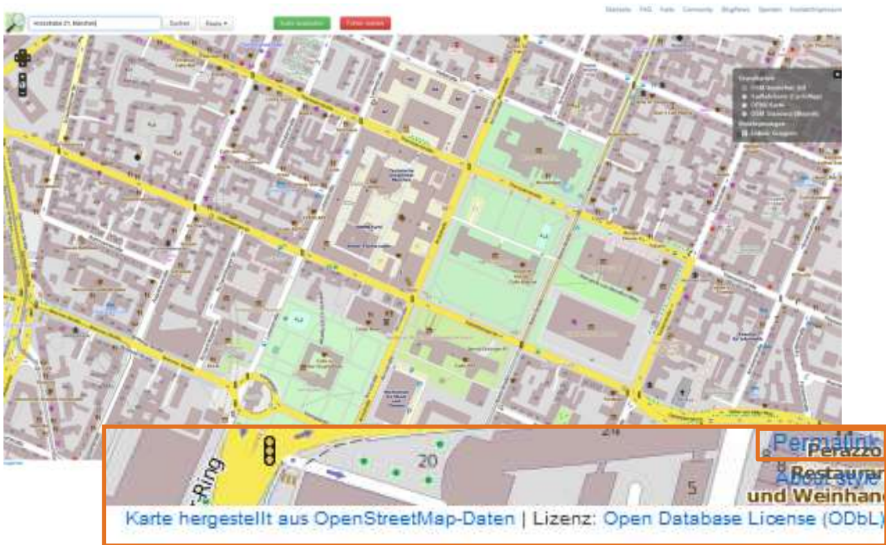
Karte 1: Arcisstraße 21, München (Open Street Maps, 2016) veröffentlicht unter Open Database License ODbL

Wenn Sie viele Karten in Ihrer Arbeit verwenden, legen Sie in Ihrer Arbeit ein Kartenverzeichnis an, in dem alle Karten aufgeführt sind.