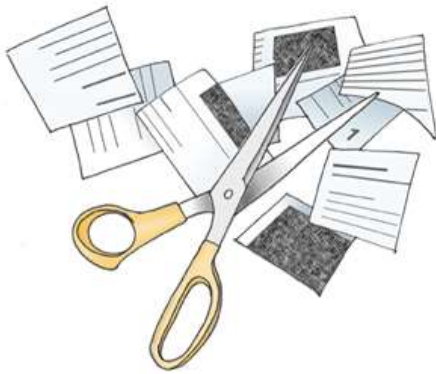
Abbildung 2: Wie wird plagiiert?! (Weber-Wulff, 2004b)

Das im Kurzbeleg genannte Werk muss im Literaturverzeichnis aufgeführt werden.