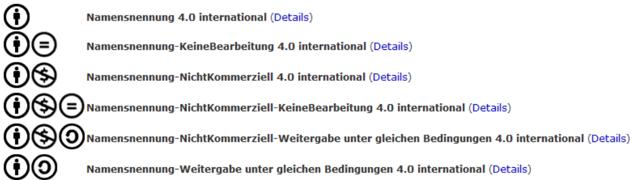
Abbildung: „Auswahl von insgesamt sechs verschiedenen CC-Lizenzen, die dem Rechteinhaber derzeit in der Version 4.0 zur Verfügung stehen“ ("Was ist CC?," 2014)

Folgende sechs Lizenzen stehen derzeit zur Verfügung 14 .