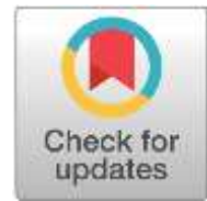
Abbildung 6: CrossMark-Button (Meddings, 2016)