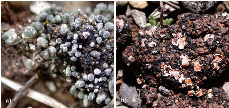
Abb. 3. Seltene Vertreter der Bunten Erdflechtengesellschaft auf dem Rollfeld in der Garchinger Heide: a) Toninia sedifolia (RL-D 2) und b) Catapyrenium squamulosum (ledrig, braun; RL-D 3) und Psora decipiens (hellbraun mit weißlichem Rand; RL-D 2). RL-D Flechten: WIRTH et al. (2018) (Fotos: M. Jeschke, Juni 2005).

auf der Garchinger Heide vor, weitere stark gefährdete Blütenpflanzen sind Adonis vernalis , Daphne cneorum , Gladiolus palustris , Iris variegata , Linum perenne , Scabiosa canescens , Scorzonera purpurea , Veronica austriaca und Viola rupestris . Das Rollfeld, ein 80 Jahre alter Oberbodenabtrag, beheimatet zudem eine Reihe besonderer Flechten. Dort finden sich mit Bacidia bagliettoana , Toninia sedifolia , Catapyrenium squamulosum und Psora decipiens eine ganze Reihe seltene Vertreter der Bunten Erdflechtengesellschaft ( Toninio-Psoretum decipientis Stodiek 1937; Abb. 3; JESCHKE 2008).