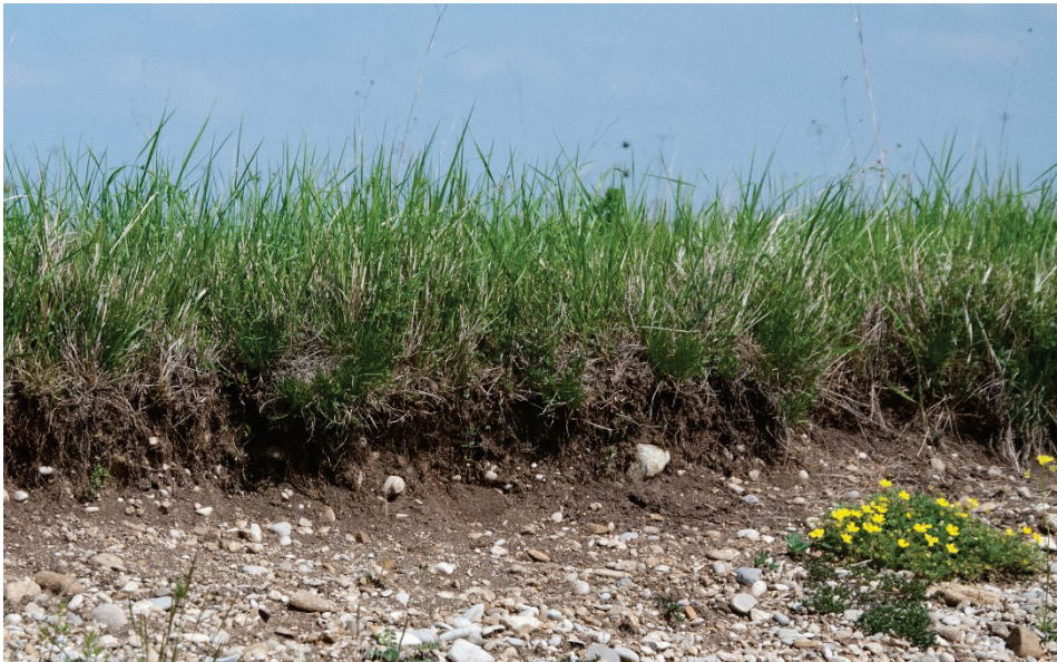
Abb. 1. Pararendzina im NSG Garchingener Heide. Unter dem dicht durchwurzelten, fast steinfreien A_h -Horizont aus sandig-schluffigem bis sandig-tonigem Lehm folgt zwischen 10–40 cm ein lehmiger A_hC_v -Übergangshorizont mit deutlich erhöhtem Kiesanteil bevor ab ca. 40 cm sandig-kiesiger Schotter ansteht. Eine geringe Feldkapazität und Nährstoffsorption sind wichtige Ursachen für das Vorkommen von Kalkmagerrasen im Gebiet. Solche ungestörten Bodenprofile sind im Gebiet kaum noch vorhanden.