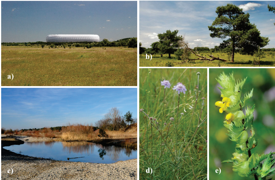
Abb. 4. Ökosysteme und Arten der Fröttmaninger Heide. a) Bei der Umwandlung des militärischen Übungsgeländes Fröttmaninger Heide wurden 347 ha als NSG ausgewiesen, neben fortbestehender militärischer Nutzung wurden weitere Teile Mülldeponie, Baugebiet oder dienen heute als Standort der Allianzarena. b) Mit Kiefern durchsetzte Grasheiden vermitteln einen Eindruck von der historischen Kulturlandschaft im Münchner Norden. c) Im Osten der Heide hinterließ die militärische Nutzung offene Schotterböden, auf denen nach häufiger Befahrung durch schweres Gerät der Kies zerrieben wurde und aus dem tonigen Verwitterungsrückstand temporär wasserstauende Flächen entstanden. d) Scabiosa canescens und e) Rhinanthus glacialis , zwei gefährdete Arten im NSG „Südliche Fröttmaninger Heide“ (a) und b) Juni 2009, c) Februar 2021, d) Juli 2010, e) Juli 2019).

Pararendzina erhalten. Auch die Nutzungsintensität der Vegetation ist sehr vielfältig. So gibt es Areale mit unterschiedlich intensiver Beweidung, andere Bereiche werden gar nicht genutzt und unterliegen der Sukzession. So finden sich an Rohbodenstandorten Arten der Sedo-Scleranthetea , auf regulär beweideten Magerrasen wachsen mehr oder minder artenreiche Trespens-Halbtrockenrasen. Nach QUINGER et al. (1994) stellen diese Kalkmagerrasen der Isarheiden Komplexgesellschaften dar, die sich synsystematisch kaum zuzuordnen lassen und deshalb als ranglose Lokalgesellschaften geführt werden sollten. Dominant sind dort in der Regel Brachypodium rupestre und Bromus erectus . Zu den gefährdeten Arten des Naturchutzgebietes gehören u. a. Scabiosa canescens , Filipendula vulgaris , Allium carinatum , Dorycnium germanicum , Asperula tinctoria , Rhinanthus glacialis und Potentilla alba (ÖKOKART 2004 in JEUTHER & HOCHREIN 2010). Bemerkenswerterweise sind diese seltenen Arten oft in die hochwüchsigen und weniger stark beweideten Grasflächen eingebunden, die im südlichen, stadtnahen Teil der Fröttmaninger Heide ihren Verbreitungsschwerpunkt haben. In den intensiver beweideten Kurzrasen der nördlichen Heide finden diese Arten offensichtlich weniger günstige Entwicklungsbedingungen. Die nach Norden zunehmende Intensität der Schafbeweidung ist nicht zuletzt durch die abnehmende Störung durch Erholungssuchende und freilaufende Hunde zu erklären (s. u.).