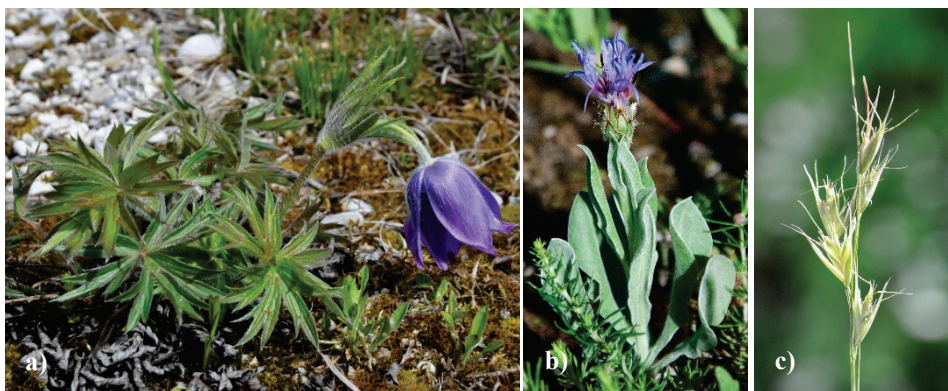
Abb. 2. a) Pulsatilla patens , b) Centaurea triumfettii und c) Danthonia alpina kommen in Deutschland ausschließlich auf der Garchinger Heide vor (a) Mai 2021, b) Juni 2017, c) Juni 2021).

Für die Garchinger Heide sind nach 1970 insgesamt 267 Gefäßpflanzenarten nachgewiesen (PÖLLINGER & KIEFER 2019). Aktuell sind für die Garchinger Heide Vorkommen von 61 Gefäßpflanzenarten bestätigt, die auf der Roten Liste der gefährdeten Pflanzen Deutschlands (RL-D; METZING et al. 2018) und/oder Bayerns stehen (RL-B; SCHEUERER & AHLMER 2003), Vorwarnstufen sind dabei nicht mitgerechnet. Dominante Arten sind Carex humilis , Anthericum ramosum und Brachypodium rupestre , denen stets eine große Zahl langsamwüchsiger und habitattypischer Gräser, Kräuter und Zwergsträucher beigemischt ist (CONRADI & KOLLMANN 2016, CONRADI et al. 2017). Pflanzensoziologisch lässt sich die Vegetation in die dichteren, an Brachypodium rupestre reicheren Formationen des Adonis vernalis - Brachypodium rupestre -Gesellschaft (vgl. RENNWALD 2000) und die weniger wüchsigen Bestände des Pulsatilla - Caricetum humilis differenzieren. Pulsatilla patens , Centaurea triumfettii und Danthonia alpina (s. Abb. 2) kommen in Deutschland ausschließlich