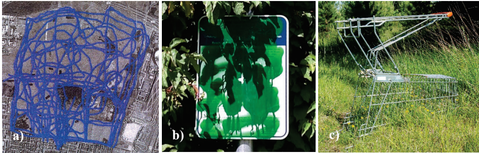
Abb. 5. Naturschutzprobleme nach der Aufgabe der militärischen Nutzung in der Fröttmaninger Heide. a) Bei nicht repräsentativer Umfrage von Studierenden erfasste Besucherbewegungen, b) übersprayed Besucherordnung am Eingang zum Naturschutzgebiet und c) aus einem naheliegenden Supermarkt entwendeter und in der Heide abgestellter Einkaufswagen (Fotos: H. Albrecht, b) August 2016, c) Juni 2009).

U-Bahnhof Fröttmaning zur Regulierung der Besucherströme; Hunde dürfen überall nur an der Leine mitgeführt werden. Im Jahr 2016 erfolgte die Ausweisung als Naturschutzgebiet durch die Regierung von Oberbayern.