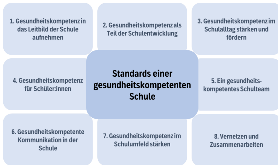
Abbildung 1: Acht Standards einer gesundheitskompetenten Schule (Kirchhoff und Okan, 2022)

Das Konzept der gesundheitskompetenten Schule beschreibt acht Bereiche (S. Abbildung 1), in denen eine Schule tätig werden kann. Dies werden „Standards“ genannt und jeder Standard enthält sechs Aspekte, die als Indikatoren definiert sind. Die Indikatoren stellen gemeinsam mit den Standards im Fragebogen die Grundlage zur Messung der organisationalen Gesundheitskompetenz der Schule dar. In erster Linie soll der Fragebogen dazu dienen, Schulen aufzuzeigen, in welchen Bereichen sie bereits pädagogisches Handeln mit gesundheitskompetentem Handeln verbinden und in welchen Bereichen eventuell noch nicht ausgeschöpftes Potenzial oder Verbesserungsbedarfe haben. Gleichzeitig sprechen die Standards sprechen unterschiedliche Wirkebenen in der Schulorganisation, die auch im Rahmen schulischer Gesundheitsförderung zentral aufgegriffen werden (s. Abbildung 2).