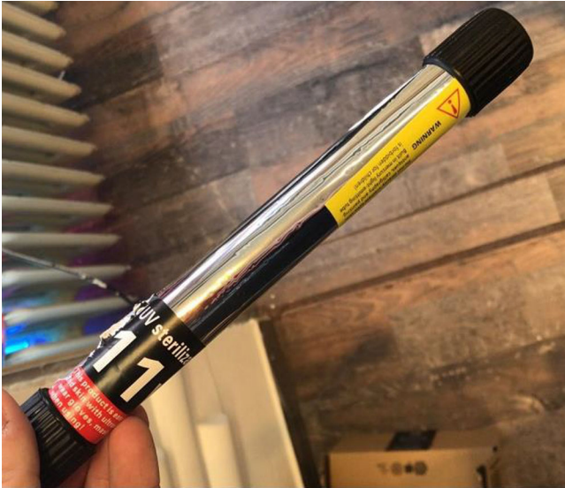
Abb. 2 ◀ Bild der verursachenden UV-Lampe

(▣ Abb. 1a, b). Intraokular zeigte sich ein reizfreies Auge. Fundusdetails erwiesen sich korneal bedingt als reduziert einsehbar, aber grob regelrecht.