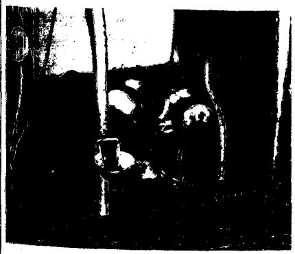
Nach neueren Erkenntnissen soll man den Bewegungsspielraum der Tiere wieder mehr erweitern. Bei einer lockeren Anbindung ist dabei eine niedrige Krippe zweckmäßig. Eine Gummischürze hält das Futter zurück.

Bei den Entmistungsarbeiten im Milchviehstall ist eine Erleichterung und eine Zeiteinsparung am ehesten durch die Verminderung der Einstreu und die Sauberhaltung der Tiere zu erreichen, wobei trotzdem für das Tier optimale Umweltbedingungen geschaffen werden müssen. Das ist um so schwieriger, je mehr funktionelle Anforderungen an die Standform gestellt werden. Beim Anbindestall treten besondere Probleme auf, da das Tier auf