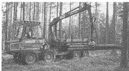
Rottne G – extrem kompakt

HSM: die deutschen Spitzen-Skidder. Was Besseres gibt's nicht.