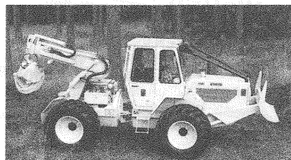
HSM 904 Z