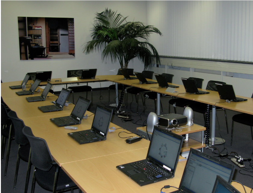
Abb. 4: Aufbau des Workshopraums mit IT-Werkzeugen zur Kreativunterstützung

Damit wurde erreicht, dass sich die teilnehmenden Ingenieure und Führungskräfte des Automobilbauers besser in ihre Kunden hineinversetzen und Ideen aus Kundenperspektive generieren konnten. Hierbei wurde zusätzlich darauf geachtet, dass im Workshop auch Teilnehmer vertreten waren, welche intensiven Kontakt zu Kunden haben. Die Ideen wurden anschließend durch die Teilnehmer des Workshops bewertet. Die bewerteten Ideen dienten dann als Basis für die Gruppenarbeiten, um konkrete Innovationsszenarios auszuarbeiten. Die ausgearbeiteten Innovationsszenarios wurden schließlich in der Gruppe präsentiert, diskutiert und nochmals bewertet.