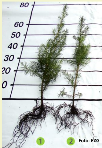
Abbildung 4: Qualitätskriterium Wurzelentwicklung: Douglasien 2+1, 50–80 cm, Pflanze 1 mit tolerrbarem Verschulknick (L-Wurzel oder Entenfuß); Pflanze 1 und 2 mit ausreichendem Feinwurzelanteil und ausgewogenem Wurzel/Sprossverhältnis ca. 1:3–1:4.