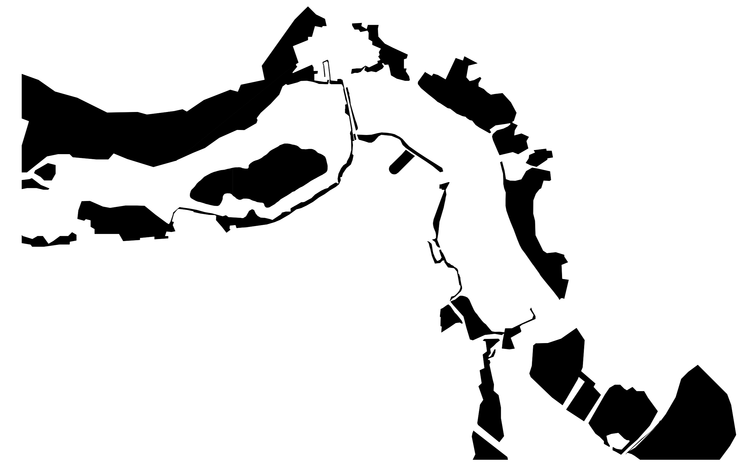
GRÜNVERNETHUNG ENTLANG DES MINCIOS 1/25000