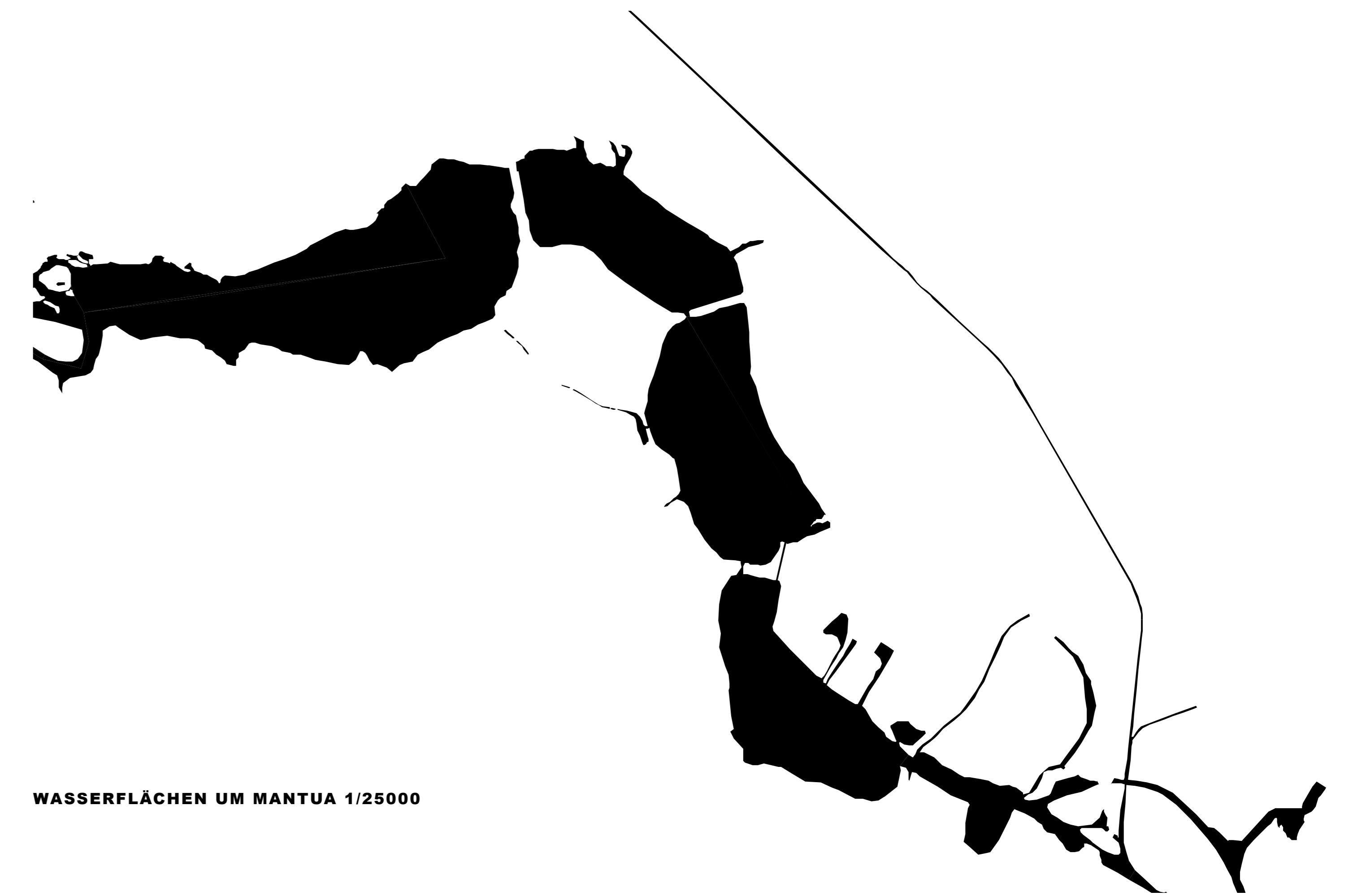
WASSERFLÄCHEN UM MANTUA 1/25000