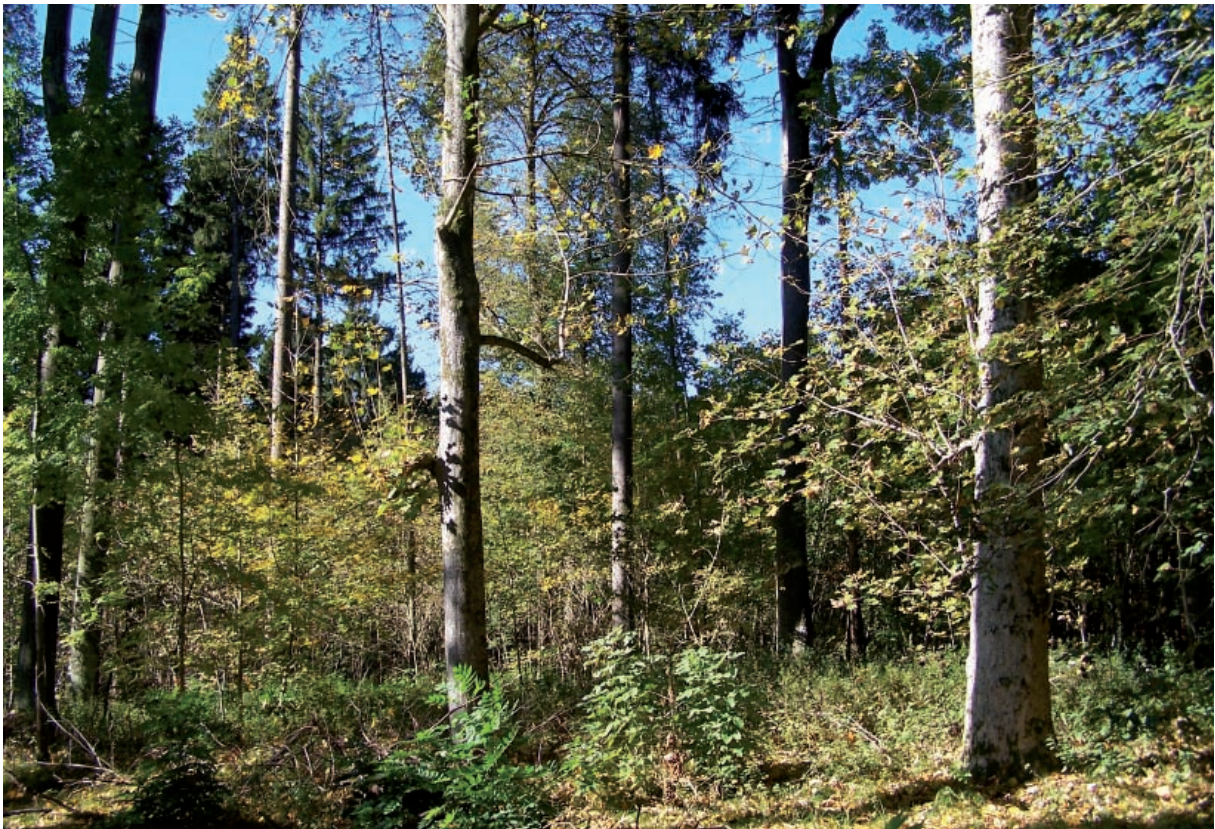
Abbildung 3: Mischbestand