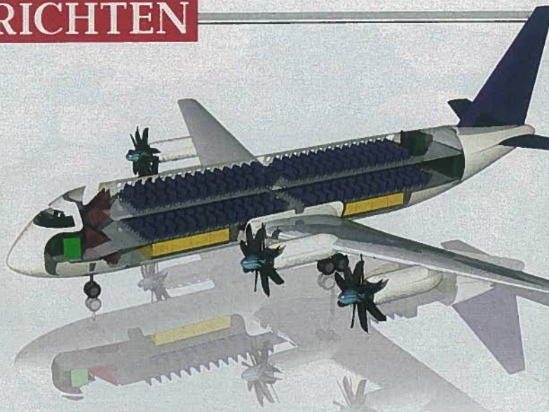
Auf zwei Stockwerken finden laut Entwurf 420 Passagiere Platz in der Propellermaschine

Ein Projekt von Musiklegende Neil Young wird Realität: Klangpuristen können jetzt den Pono Music Player auf kickstarter.com vorbestellen. Das 400 Dollar teure Gerät liefert Musik in Studioqualität. Dateien im gängigen MP3- oder AAC-Format sind stark komprimiert, wobei ein Teil der Klangdaten verloren geht. Der Pono Player dagegen