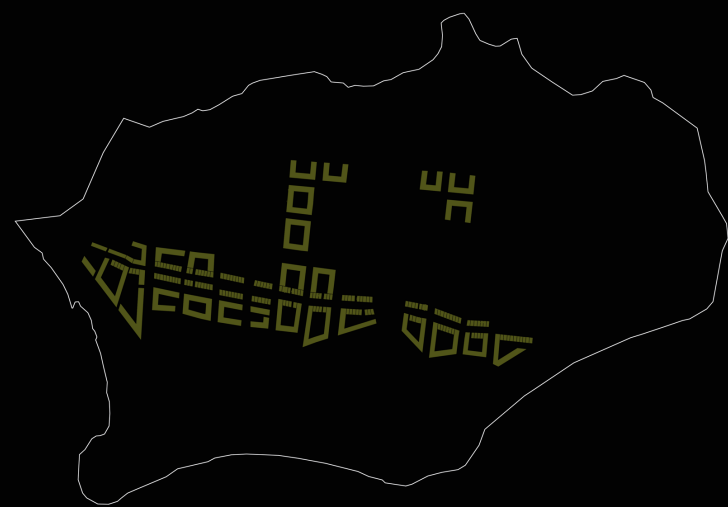
Mischgebiet (Wohnen, Dienstleistung, Büro, Shopping, Hotel)