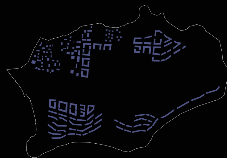
Wohngebiete mit Nahversorgung