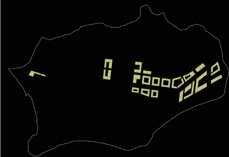
Büro, Verwaltung, Dienstleistung